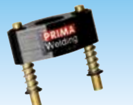
DRT cod. 982012