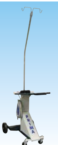
CARMIG cod. 981210