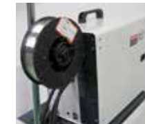
SPB 200 cod. 981218