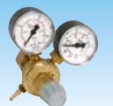
RDP cod. 981012