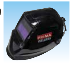
EVOLUTION PLUS cod. 981038