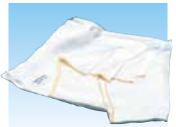
PRIMATEX 130 cod. 980300