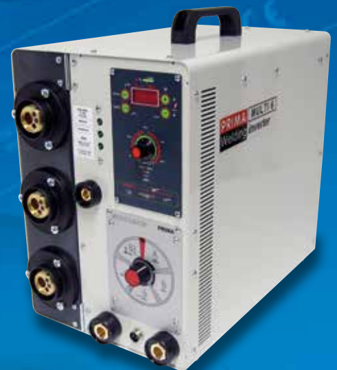
Prima Multi 6 + 3 T01530 + 2 RDP + CM16 + KSP + MR cod. 981203