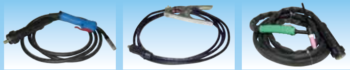
TO 1530 cod. 981002