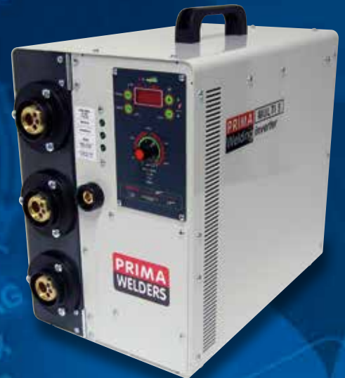
Prima Multi 5 + 3 T01530 + 2 RDP + CM16 cod. 981202